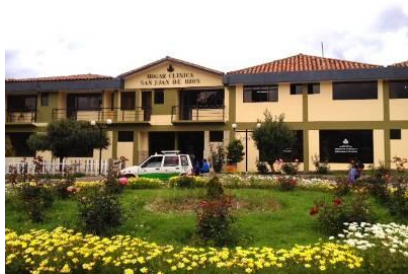
H: San Juan de Dios, Cuzco, Perú.

A lo largo de 2018 hemos apoyado especialmente al proyecto de Burkina Faso , cuarto país más pobre del Mundo: construcción de quirófano, taller de óptica y becas a dos oftalmólogas y un óptico locales, los futuros líderes del proyecto que estará plenamente operativo a finales de 2019. También hemos adquirido nuevos equipos y enviado fondos para la compra de un terreno.