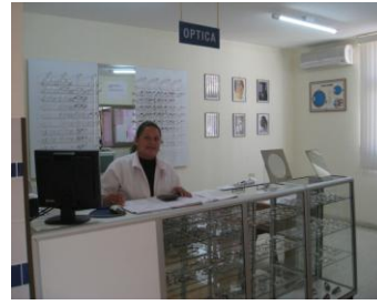
Centro de oftalmología en Santa Cruz, Bolivia

Visión Mundi colabora en la construcción, equipamiento, formación del personal y gestión de centros de oftalmología, con la condición de que sean llevados 100% por personal local y ayuden a la población más vulnerable.