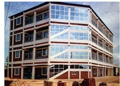
Centro médico Eureka. Burkina Fasso