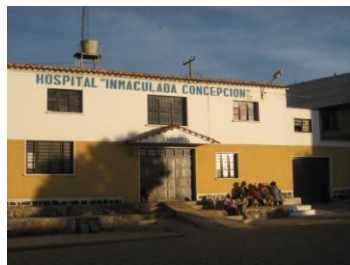
H. de La Concepción. Potos