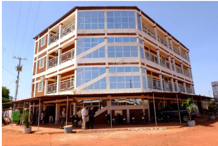
Centro Médico Eureka