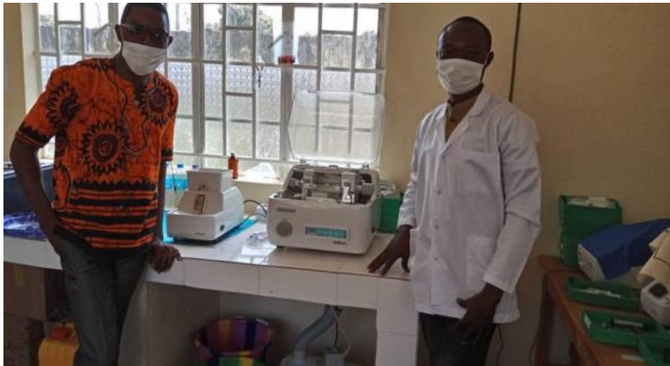
Técnicos y equipos del taller de óptica