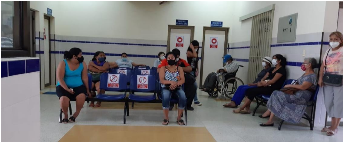
Centro oftalmológico en Sta. Cruz de La Sierra, Bolivia, con medidas COVID.