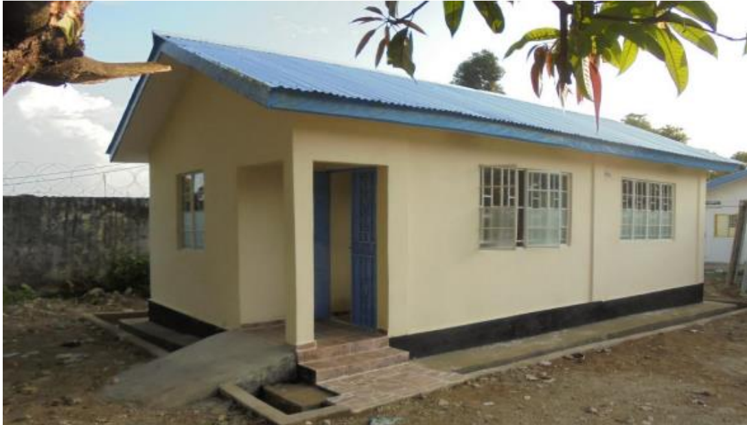
Parte externa del taller de óptica

Los especialistas han podido regresar a sus lugares de trabajo y seguir atendiendo a la población que lo necesita.