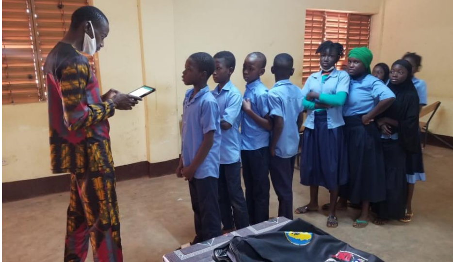
Campañas a escolares en Bobo Dioulasso, Burkina Faso.

Pese a las dificultades que ha impuesto la pandemia de COVID 19 este año 2020 se ha seguido apoyando al Centro Médico Eureka gracias a la colaboración del Ayuntamiento de Logroño, mediante el envío de equipos y capacitación de personal local. Como novedad, este año se han iniciado las campañas de screening a escolares llevadas a cabo por el personal de óptica formado también por Vision Mundi.