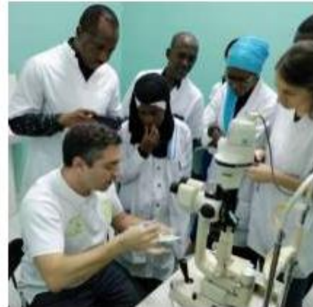
Becarios en Dakar